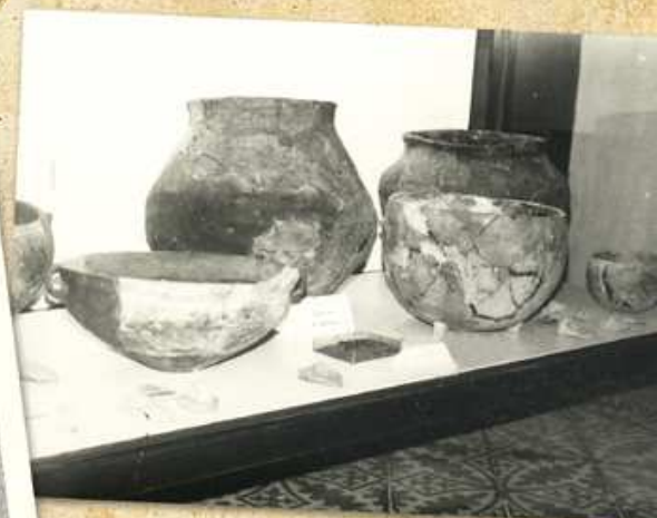
El Museo Arqueológico Municipal sito en la calle Jorge Juan nº 1. Novelda, 1980-1983.

instalado, a principios de 1980, en la primera planta del antiguo palacio de la Señoría, situado en la calle Jorge Juan nº 1.