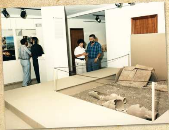
Exposición: Arqueología en Alicante, 1976-1986 . Inaugurada en Novelda en junio de 1987 en la Sala de Exposiciones de la Casa de Cultura.

También se fueron desarrollando diversas actividades relacionadas con el pasado histórico de Novelda a través de conferencias, congresos y jornadas.