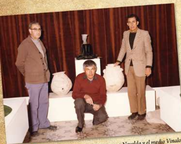
Vieta de la Exposición: Arqueología en torno a Novelda y el medio Vinalopó Sala de Exposiciones de la Caja de Ahorro de Alicante y Murcia. Novelda, febrero de 1978.