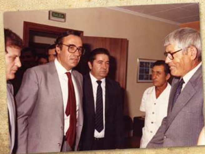
Inauguración de las nuevas instalaciones del Museo Arqueológico en la 2ª planta de la Casa de Cultura, el 23 de julio de 1983, por D. Gregorio Peces-Barba, Presidente del Congreso de los Diputados.

En 1983, tras ser reconocido oficialmente por el Ministerio de Cultura, el Museo Arqueológico fue trasladado a las nuevas dependencias de la Casa de Cultura.