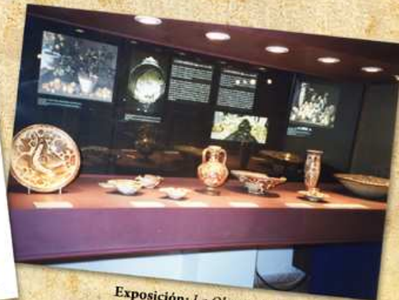
Exposición: La Obra Dorada. Los Colores del oro en la cerámica valenciana. Casa de Cultura. 1997.