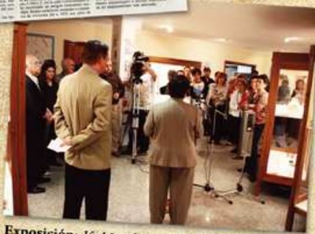
Exposición: 15 Años de Arqueología Urbana. Novelda, 2007.

El interés que el público muestra en estas actividades nos anima a seguir realizándolas en años sucesivos.