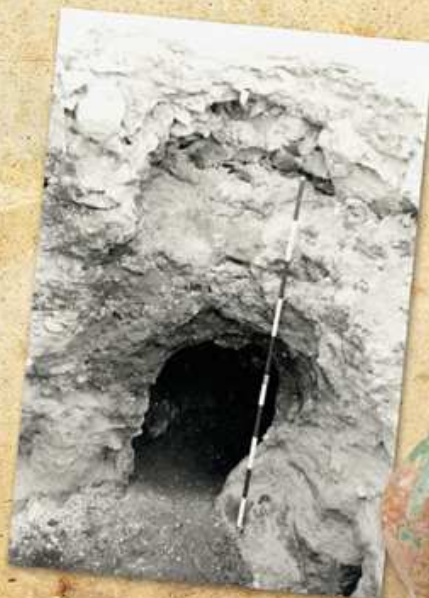
Intervención arqueológica en la Casa de la Señoría (1986).