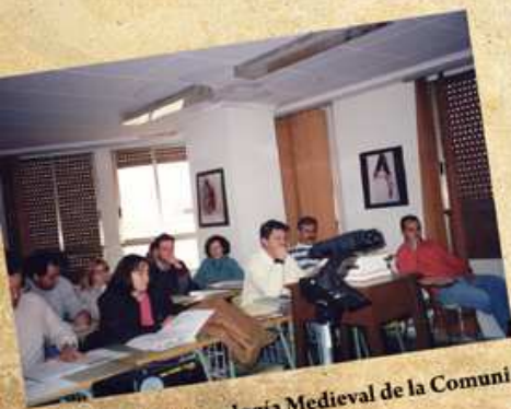
I Jornadas de Arqueología Medieval de la Comunidad Valenciana. Novelda, 1996.