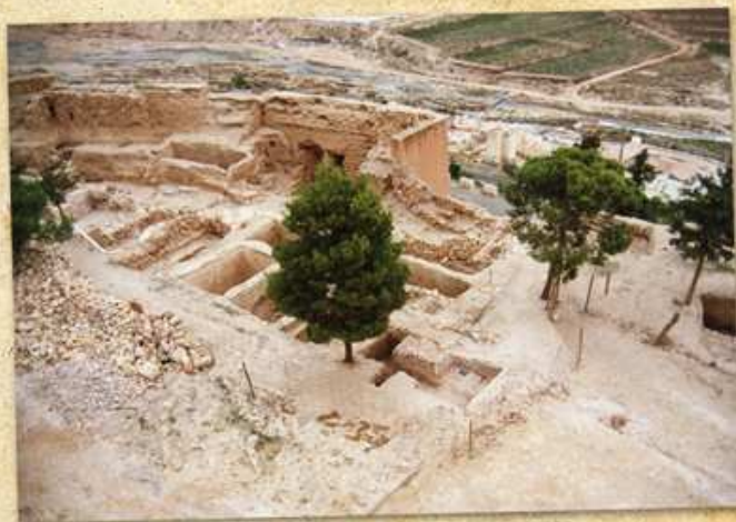
Vista de las excavaciones arqueológicas en el Castillo de la Mola (1983-1990)

Con el inicio de las excavaciones arqueológicas en el Castillo de La Mola en 1983, y las primeras intervenciones urbanas en 1986, los fondos museográficos van a ir incrementándose progresivamente, haciéndose cada vez más palpable la necesidad de disponer de nuevos espacios que permitiesen la conservación y exposición de los objetos hallados.