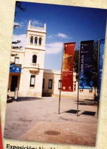
Exposición: Novelda. Arqueología y Museo. Alicante, 2005.

Las exposiciones temporales han sido uno de los mejores nexos de unión entre el Museo y la sociedad, ya que a través de los objetos expuestos en ellas se transmiten los rasgos más significativos de la vida y costumbres de nuestros antepasados.