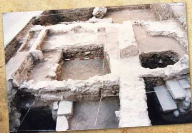
Vista de la excavación arqueológica urbana en la Plaza de San Felipe (1992).