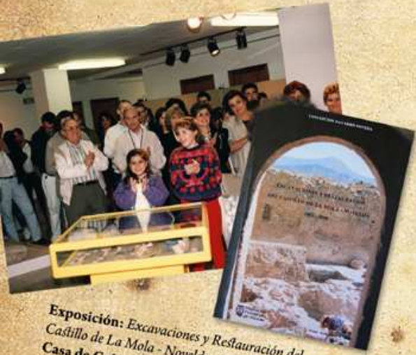
Exposición: Excavaciones y Restauración del Castillo de La Mola - Novelda. 1983-1990. Casa de Cultura. Octubre de 1992.

Actividades desarrolladas por el Museo en los años 90, relacionadas con la divulgación del Patrimonio local, en colaboración con entidades como la Dirección General de Promoción Cultural, Museos y Bellas Artes de la Consellería de Cultura, la Universidad de Alicante, el Instituto Juan Gil Albert, el Museo Arqueológico Provincial de Alicante, la Asociación Española de Arqueología Medieval... para el desarrollo de Exposiciones, Publicaciones, Congresos, Ciclos de Conferencias, entre otros eventos.