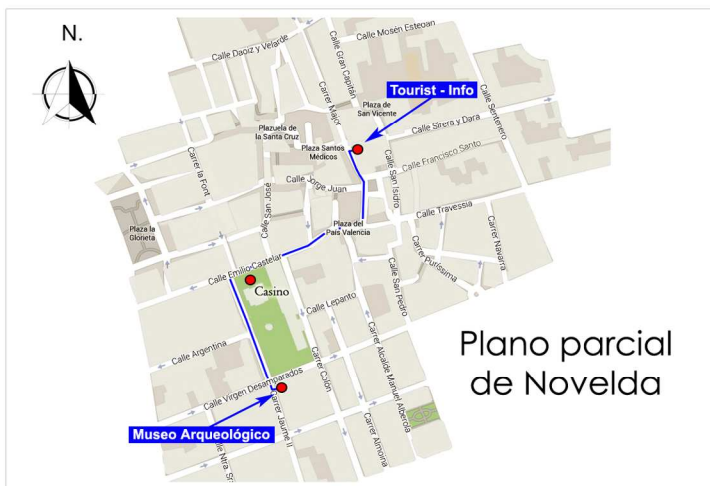
Plano parcial de Novelda

Ayuntamiento de Novelda Concejalía de Cultura y Patrimonio