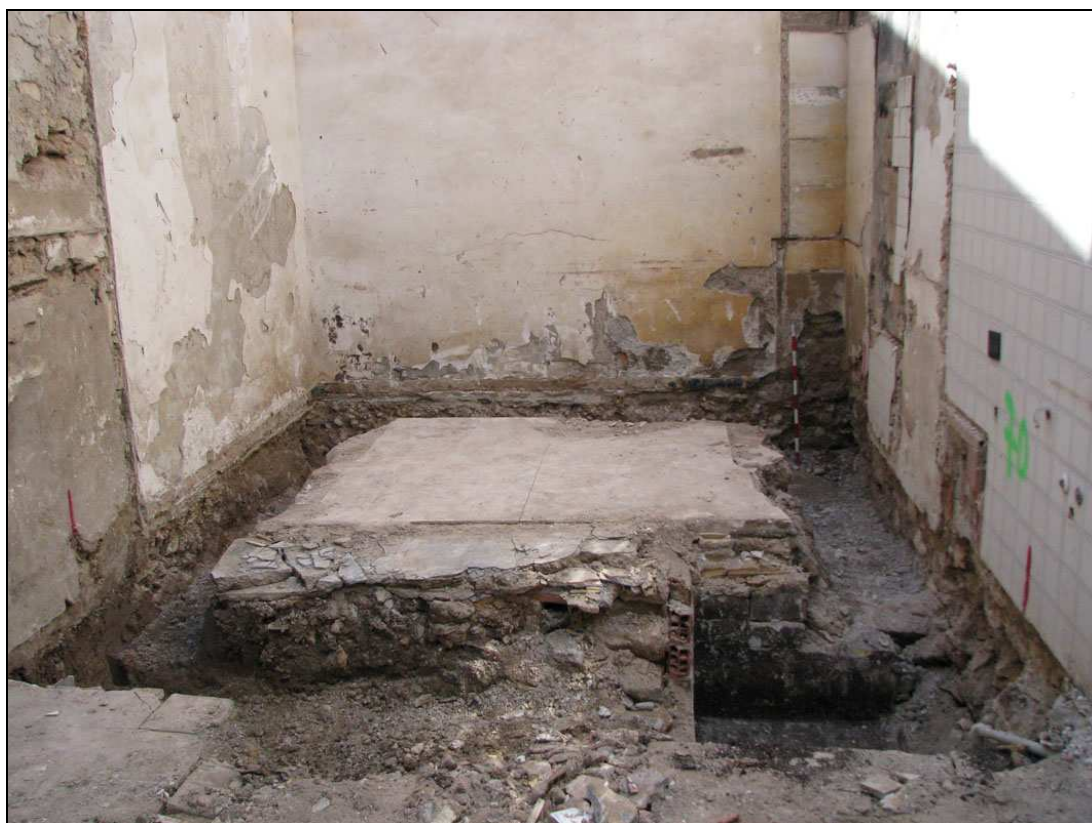
Vista de la cimentación norte al final de la intervención.