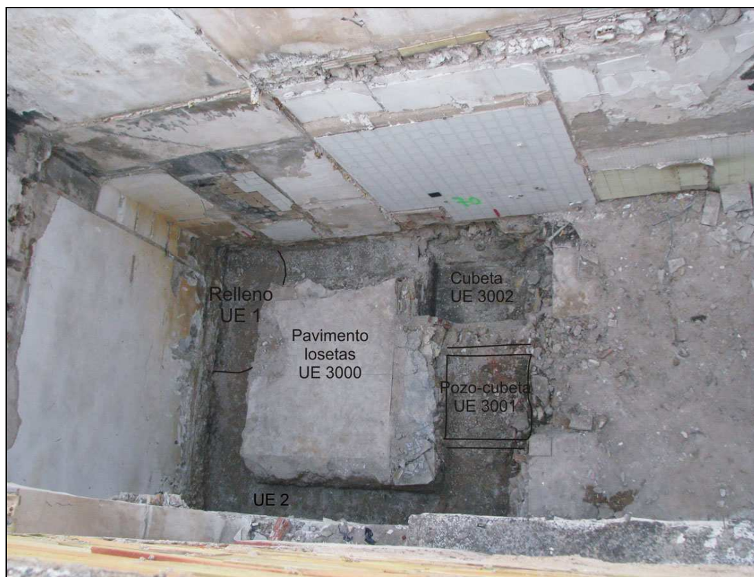
Vista cenital de la cimentación norte.