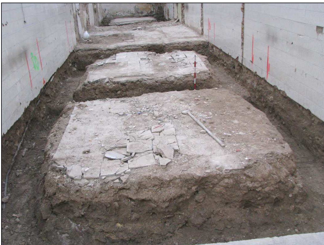
Vista final de la actuación. En primer plano, la cimentación sur.