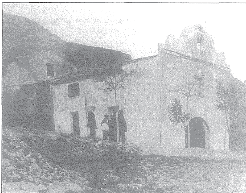
FIGURA 1: Antigua ermita de Santa María Magdalena en el Castillo de La Mola (Novelda).