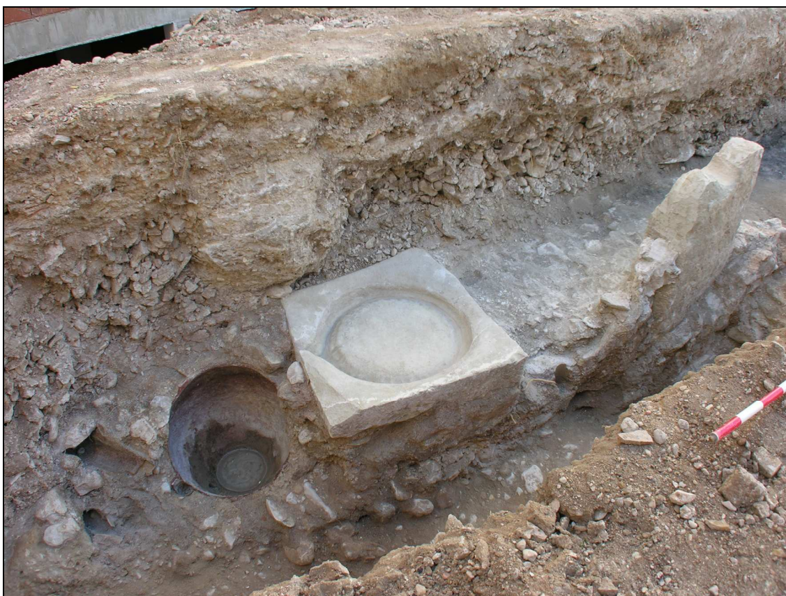
Detalle de las estructuras de lagar documentadas en el sondeo 2.