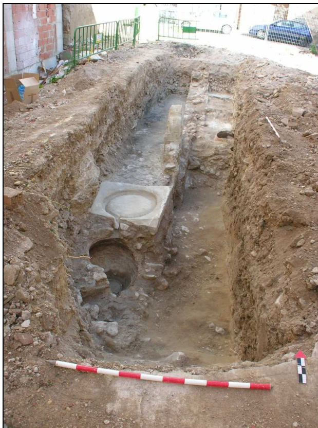
Vista del sondeo 2 una vez finalizado.